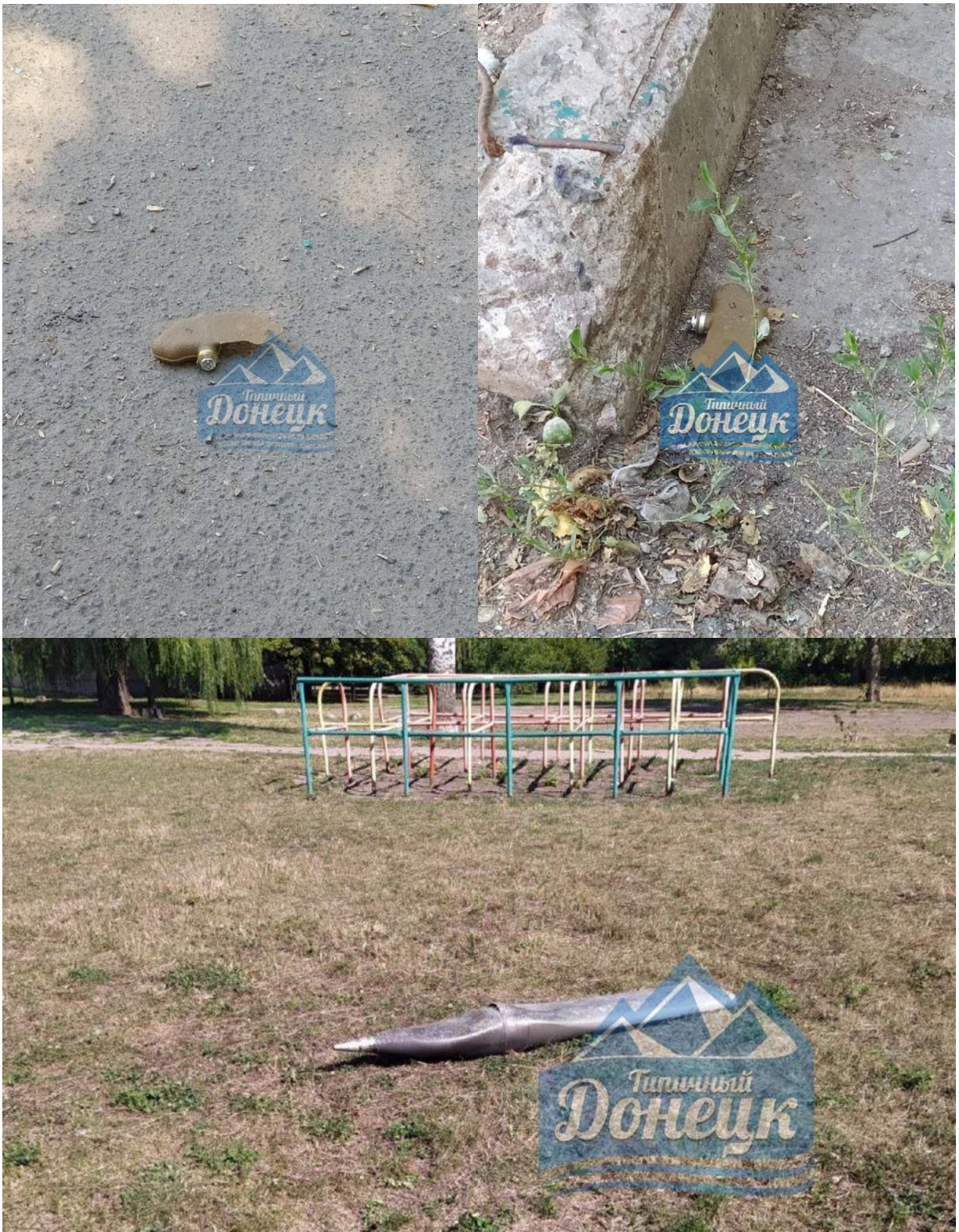
Рис. 6 - Фрагмент РСЗО «Ураган» по адресу ул. Семашко, д. 34а.