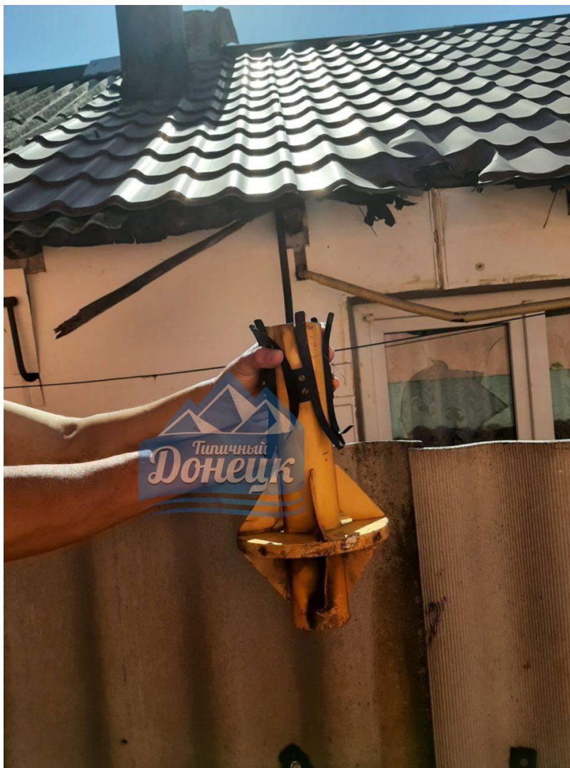
Рис. 5 - Фрагмент РСЗО "Ураган" на Саврасова 72

Ещё один элемент крепления кассет от реактивного снаряда 9М27К3 был обнаружен 30 июля 2022 года около 16:00 (МСК) жителями Донецка по адресу ул. Саврасова, дома 72 12 .