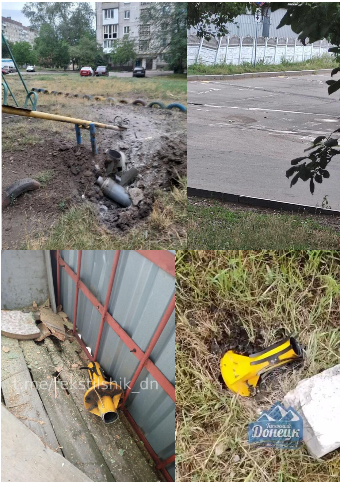
Рис. 4 – Результат минирования по ул. Терешковой.