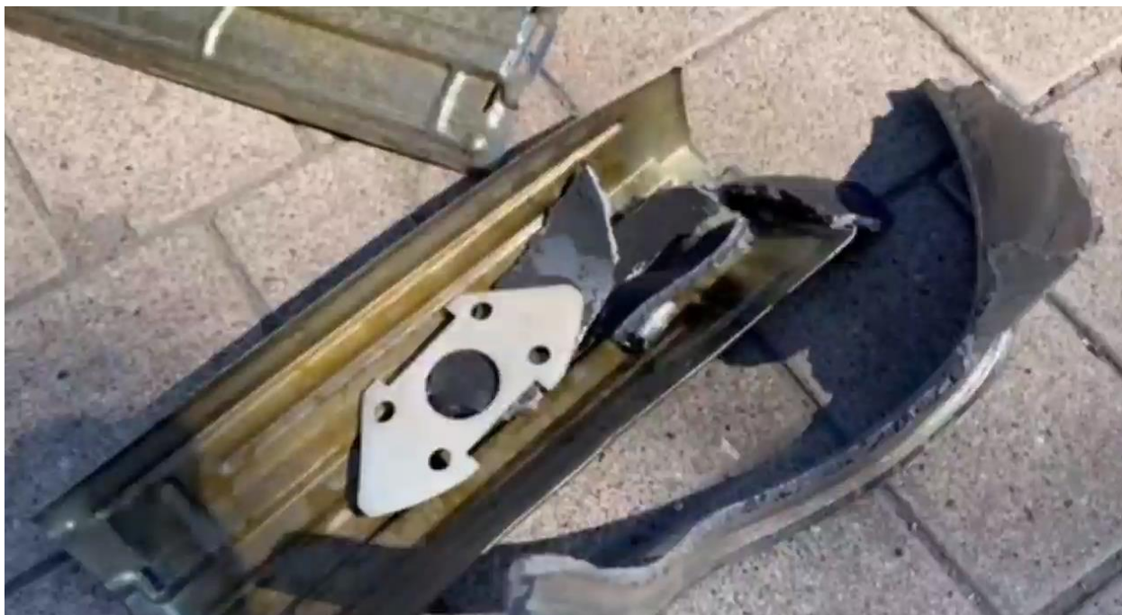
Рис. 7 – Корпус кассеты КПФИ-1С и обломки реактивного снаряда РСЗО «Ураган» в центре Донецка.

Обломки корпуса реактивного снаряда РСЗО «Ураган» были обнаружены и в центре города Донецка вместе с корпусом кассеты КПФМ-1С 14 .