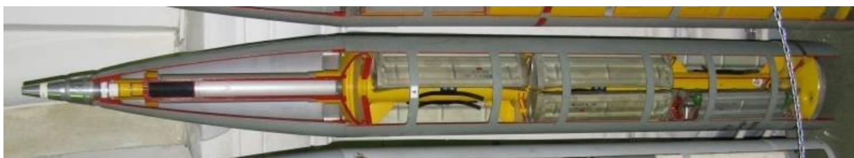
Рис. 1 - Макет изделия 9М27К3 с противопехотными минами.

Внутри головной части 9Н128К3 в три яруса продольно размещаются 12 кассет КПФМ-1М; рядом с ними находится вышибной заряд. Каждая кассета вмещает 26 противопехотных мин ПФМ-1 «Лепесток». Суммарно ракета несет 312 мин. На нисходящей части траектории снаряд должен сбрасывать кассеты, после чего те раскрываются и рассеивают по местности свое содержимое. 5