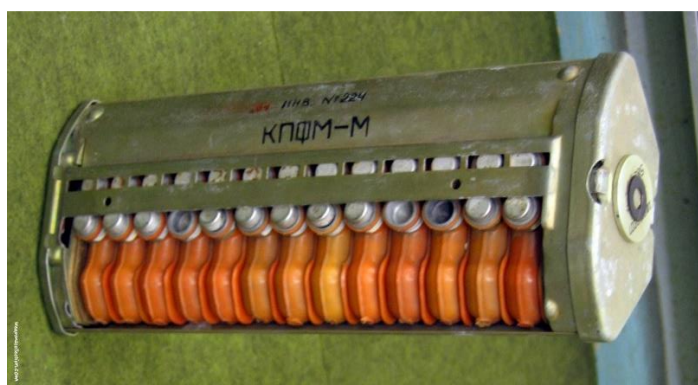
Рис. 2 - Кассета КПФМ-1М с минами ПФМ «Лепесток».